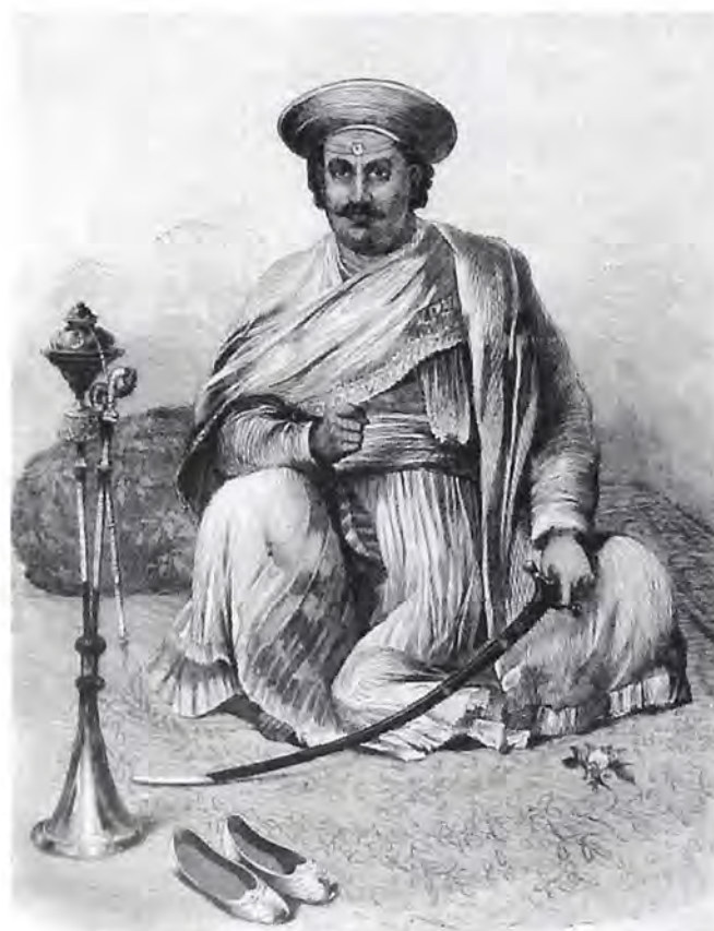
Afb 2. Nana Sahib. L'Universe Illustré , 1865, p.148. (coll. Bert van der Lingen)

Als reactie op mijn artikel kreeg ik in de maanden erna een tweetal sterk op elkaar gelijkende gravures toegestuurd waarop Nana Sahib is afgebeeld. Op één van deze gravures is hij zittend naast een waterpijp afgebeeld. (afb.