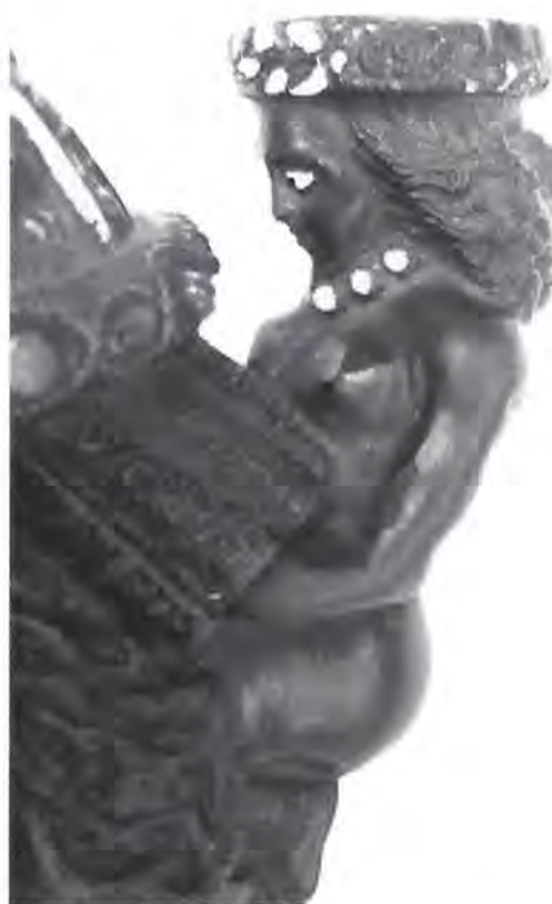
Afb 3 en 4. Nana Sahib. Firma Gambier, Givet, Frankrijk